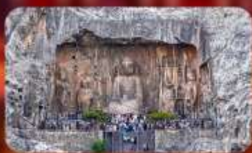
ถ้ำผาหลงเหมิน