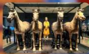
สุสานทหารจิ้นซี