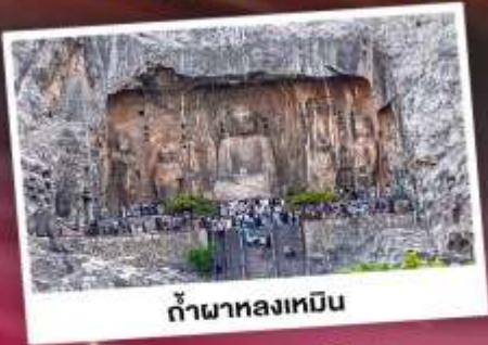
ถ้ำผาหลงเหมิน