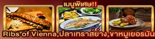
Ribs of Vienna, ปลาเทราสย่าง, じゃหมูเยอรมัน

Zugspitze Munich Salzburg Hallstatt Bratislava