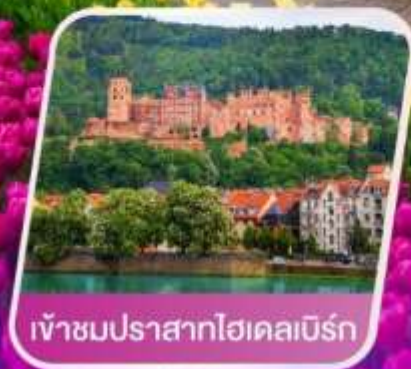
เข้าชมปราสาทไฮเคลมเบิร์ก