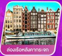
ส่องเรือสิงคารถะจก

✈️ เดินทาง 01- 08 เม.ย. 69 | 30 เม.ย.- 07 พ.ค.69