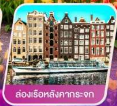
ล่องเรือหลังคากระຈก