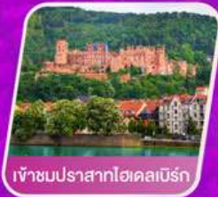
เข้าชมปราสาทไฮเดลเบิร์ก

เที่ยวเทศกาลดอกไม้เคอเคนฮอฟ ชมแคว้นอาลซัส หมู่บ้านสวยที่สุดในฝรั่งเศส เยือนเมืองมรดกโลก