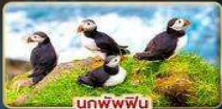
นกพิงฟิน

เดินทาง : 30 เม.ย. - 07 พ.ค. | 23-30 ก.ค. 69