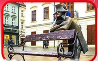
ย่านเมืองเก่าปราทิสลาวา

เที่ยวเมืองสวยริมทะเลสาบ ฮัลล์สตัดท์ • ชมเมืองไข่มุกแห่งโบฮีเมีย เซสกี กรุงลอน • ปราก • เวียนนา • ซอปปิงพาร์นดอร์ฟ เอาก์เลิน