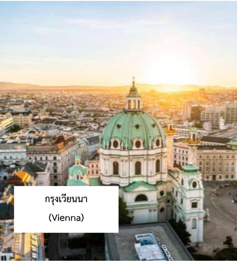
กรุงเวียนนา (Vienna)

เมนูพิเศษ!!! กลูชาซซูป อาหารประจำชาติฮังการี