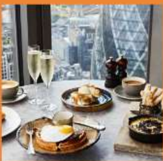
DUCK AND WAFFLE