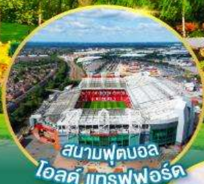
สนามฟุตบอล โอลด์ แทรฟฟอร์ด