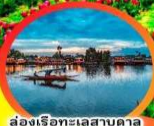
ล่องเรือทะเลสาบดาล