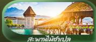
สะพานไมซ์าเปิล

เดินทาง 02-10 เม.ย. 69 / 04-12 เม.ย. 69 24 เม.ย. - 02 พ.ค. 69 29 เม.ย. - 07 พ.ค. 69 / 29 พ.ค. - 06 มิ.ย. 69