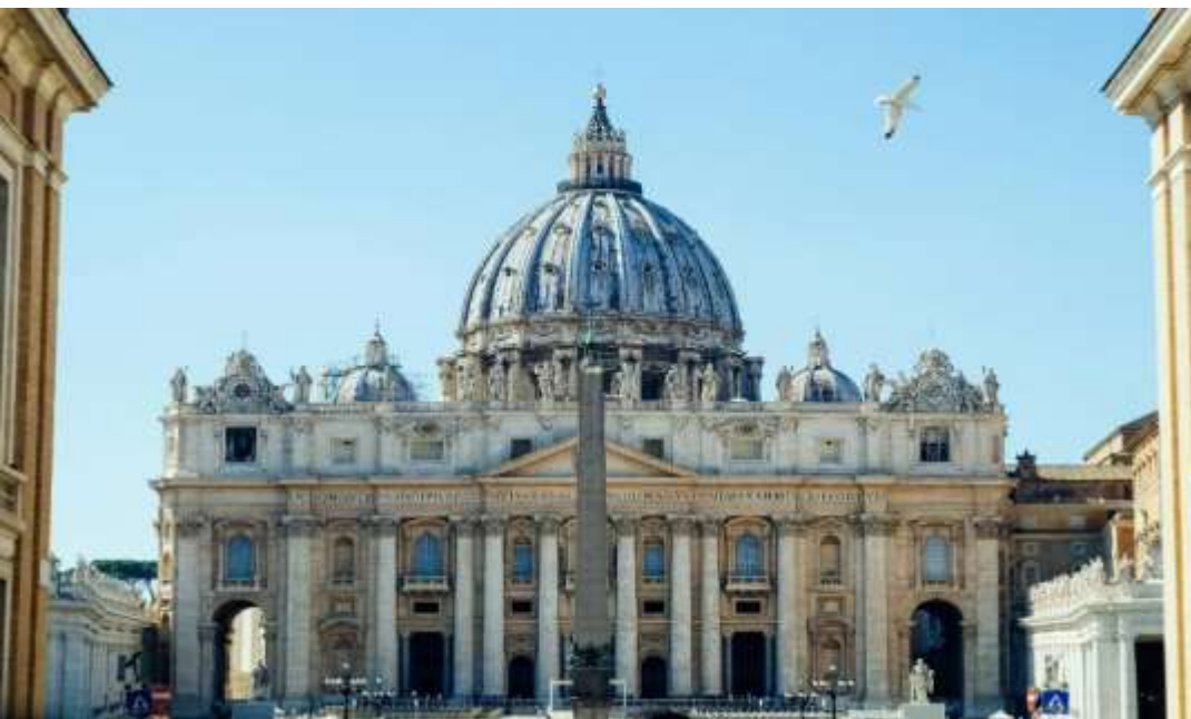
มหาวิหารนักบุญปีเตอร์ (ST. PETER' BASILICA)

(กรณีมีพิธีด้านใน หรือถ้าหากมีผู้เข้าชมเป็นจำนวนมากจนไม่สามารถเข้าชมได้ทันเวลา ทั้งนี้เพื่อมิให้กระทบต่อกำหนดการท่องเที่ยวอื่นๆ ภายในโปรแกรมทัวร์" อาจจะไม่ได้รับการเข้าชม)