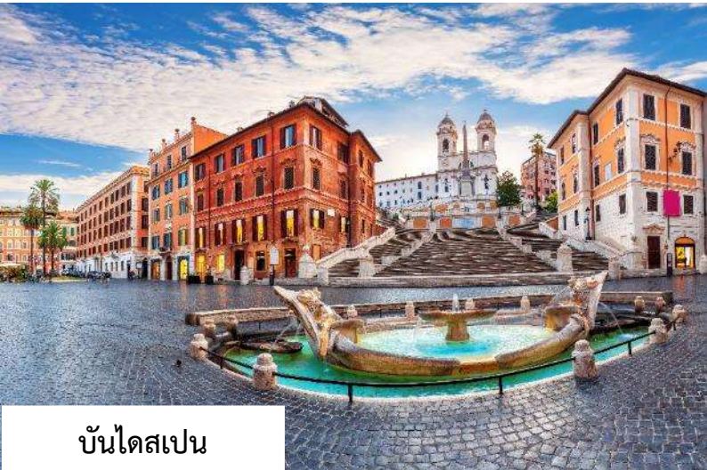
บันไดสเปน (SPANISH STEPS)