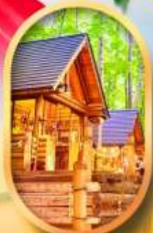
บึงเทิลเกอเรส