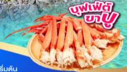
บุฟเฟ่ต์ ขาปู