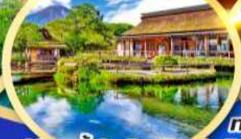
หมู่บ้านน้ำใสโอชิโนะอัทโท