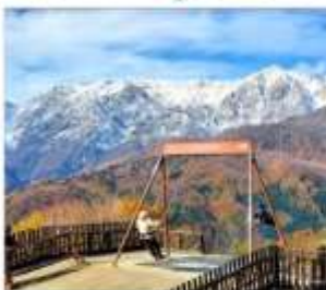
ซาคุนะอิวาทาเกะ