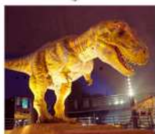
พิพิธภัณฑ์ไดโนเสาร์