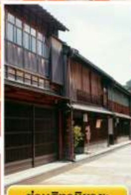
ย่านอิงาชิซายะ