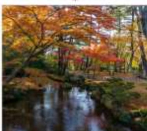
สวนเคนโระคุเซ็น