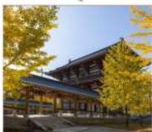
วัดไดชิซังเซอิโดจิ