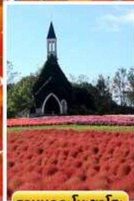
สวนบกกะโนะซาโตะ