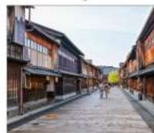
ย่านโรงน้ำชาอิงาชิบายะ