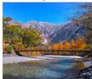
ดามิโดจิ