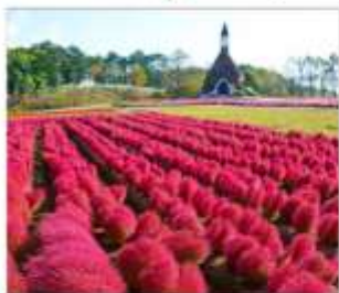
สวนดอกไม้มัมกคะโนะซาโตะ