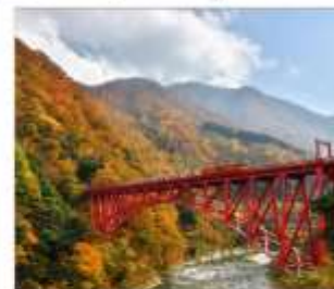
รถไฟชมวิวยุเมเวาคุโรเมะ