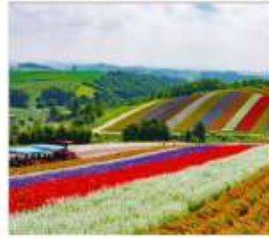
ทุ่งดอกไม้หลากสี