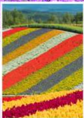
ทุ่งดอกไม้หลากสี