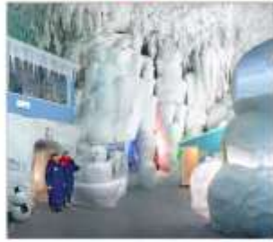
พีพีธภัณฑ์น้ำแข็ง