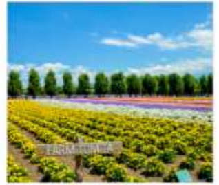
ทุ่งลาเวนเดอร์โทมิตะ