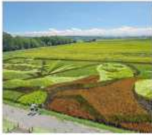
ทีลปะบนทุ่งนา