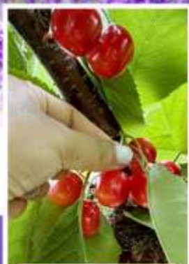
กิจกรรมเก็บเชอร์รี่

ออนเซ็น 2 คืน นน.กระบี่ 23 กก. 1 ใบ 6Days 4Night