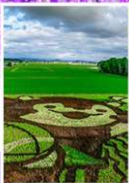
ศิลปะบนทุ่งข้าว