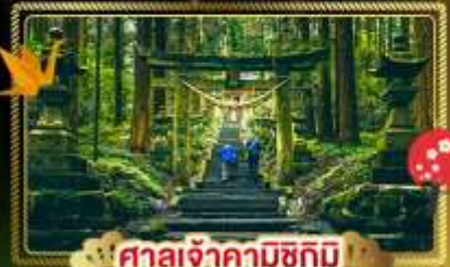
🏯 ศาลเจ้าคามิซึกิ