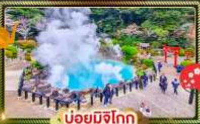
♨️ บ่อน้ำพุร้อน