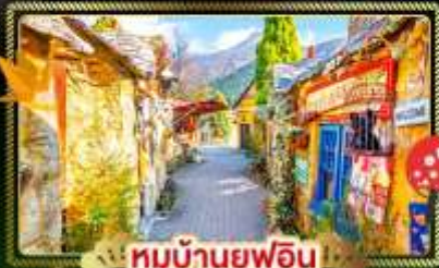
🏠 หมู่บ้านญี่ปุ่น