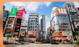
ซ้อปปิ้งชินจูกุ