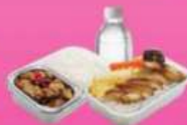
บริการอาหารร้อนบนเครื่อง ซาโป - ซากสับ