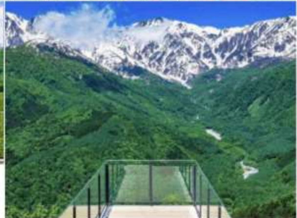
HAKUBA MOUNTAIN HARBOR THE CITY BAKERY