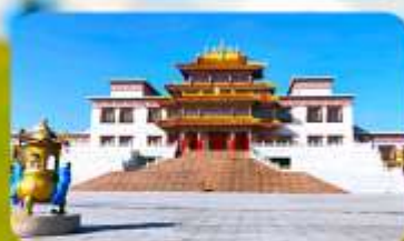
คฤหาสน์พุทธบูชาแห่งชีวิคยูลาน