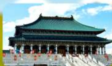
พระราชวังต้องห้ามออร์ดอส