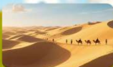
เนินทรายอินเคินทาลา