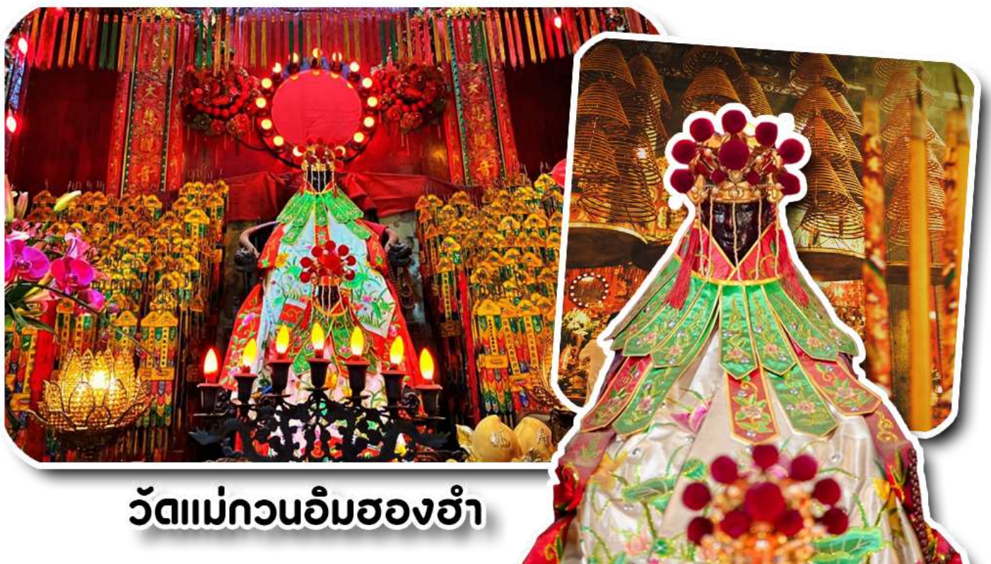
วัดแม่กวนอิมฮ่องฮำ

1873 เป็นวัดขนาดเล็กที่มีชาวฮ่องกงศรัทธาแน่นทึบกันเป็นอย่างมาก วัดแห่งนี้เป็นที่ประดิษฐาน องค์เจ้าแม่กวนอิมฮ่องฮำ ที่มีชื่อเสียงเรื่องการให้กู้ยืมเงิน เชื่อกันว่าท่านช่วยพลิกฟื้นเศรษฐกิจของชาวฮ่องกง ผู้คนจึงนิยมมายืมเงินทำธุรกิจจนสำเร็จร่ำรวย รุ่งเรือง โดยให้ท่านอธิษฐานขอพรต่อหน้าเจ้าแม่กวนอิมฮ่องฮำ พร้อมกับระบุวันเวลาในการขอพรด้วย จากนั้นนำธนบัตรตามฐานะและศรัทธาที่ท่านจะนำไปเป็นสื่อในการขอพร เขียนจำนวนเงินที่ต้องการลงไปด้วย ใส่สกุลเงินยิ่งดีใหญ่ แล้วนำเงินใส่ในซองแดง ควรเตรียมซองแดงไปเอง นำซองแดงไปวนรอบกระถางรูปวงขวาจำนวน 3 ครั้ง แล้วเก็บซองแดงในกระเป๋าสตางค์ เป็นเงินขวัญถุง ถ้าประสบความสำเร็จตามที่มุ่งหวังให้นำเงินในซองแดงทำบุญหยอดตู้ที่วัดแห่งนี้ในโอกาสต่อไป วิธีไหว้ให้ปัง ให้ได้โชคลาภเงินทอง ต้องไปกับเราเท่านั้น