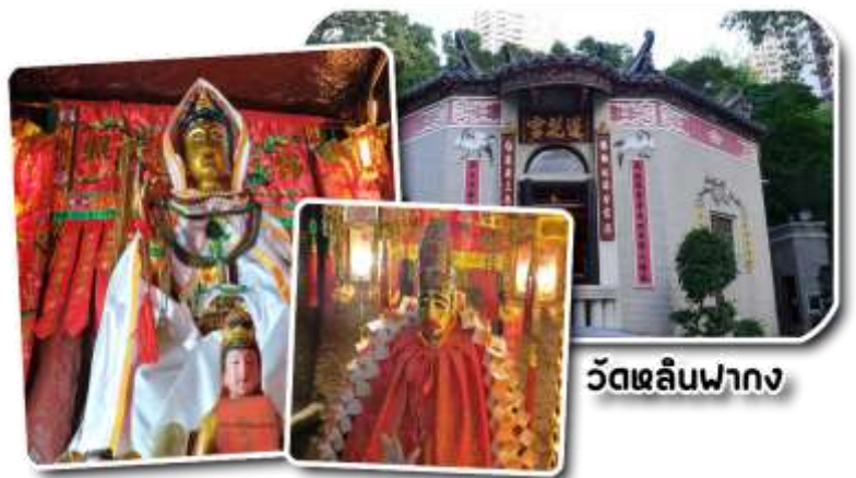
วัดหลินฟา

(Lin Fa Kung Temple) หรือ วัดดอกบัว เป็นวัดที่อยู่บริเวณหว่านจ่าย ทางทิศตะวันออกเฉียงเหนือของคอสมเวย์เบย์ โดยวัดนี้จะถูกก่อสร้างในช่วงราชวงศ์ชิง หรือ ปี ค.ศ. 1963 มีการบูรณะอีกครั้งในปี ค.ศ 1986 และ 1999 มีเจ้าแม่กวนอิมเป็นองค์ประธานของวัด โดยมีตำนานเล่าว่า เจ้าแม่