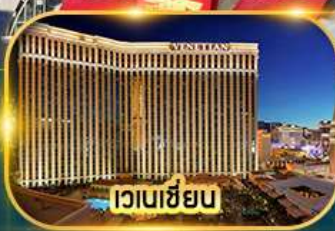
เวเนเซียน