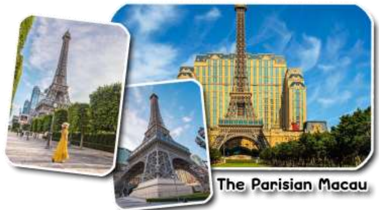
The Parisian Macau

และนำท่านชม The Parisian Macao (เดอะปารีสเซียน มาเก๊า) เป็นอีกหนึ่งแลนด์มาร์คของมาเก๊าที่ได้ยกหอไอเฟลมาจำลองใจกลางเมือง Cotai Strip โรงแรมแห่งนี้ได้รับแรงบันดาลใจมาจากเมืองปารีส ประเทศฝรั่งเศส นครแห่งศิลปะที่มีความงดงามทางด้านสถาปัตยกรรม ความโดดเด่นของหอไอเฟลกลิ่นอายของความคลาสสิกและความโรแมนติกมาไว้ที่โรงแรมแห่งนี้