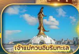
เจ้าแม่กวนอิมริมทะเล