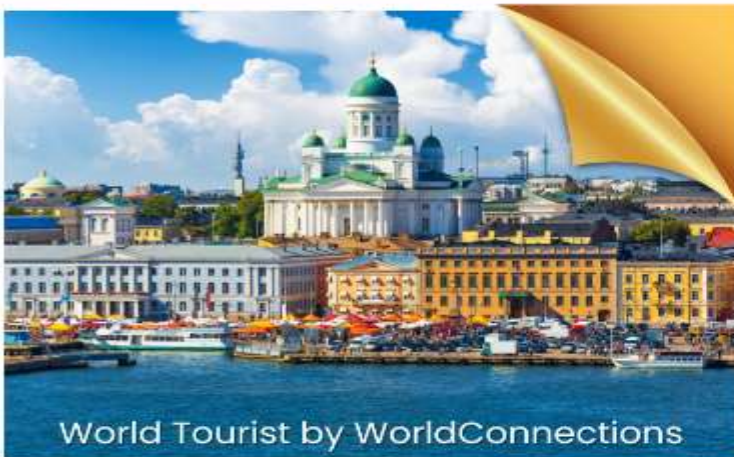
World Tourist by WorldConnections