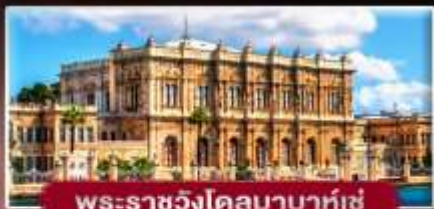
พระราชวังโดลมาบาห์เซ่

พิเศษ..พักคํปปาโดเทีย 2 คืน ฟรี! ไอศกรีมทํานละ 1 SCOOP