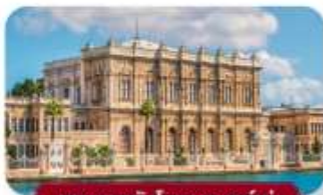
พระราชวังโดลมาบาห์เซ่