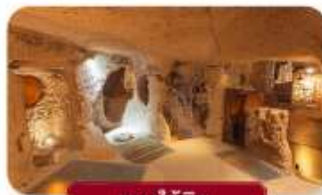
นครใต้ดิน