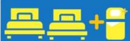
เตียง 3 ก้น ที่นอนเสริม TRIPLE