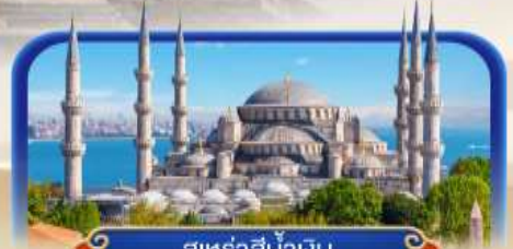
สุหร่าสีน้ำเงิน

เที่ยวเมืองอันต์ลยา บรรยากาศริมทะเลเมดิเตอร์เรเนียน พร้อมเข้าชมสวนเทพนิยายซาฮาวา บินภายใน 1 ชมไม่ย้อนเส้นทาง