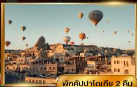
พิกคิปปาโดเกีย 2 คืน