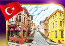
ชมบ้านหลากสีย่านบาลีก