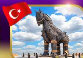
ม้าไม้เมืองทรอย ซานิคคาล