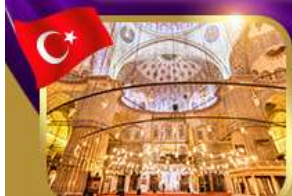
เข้าชมความงามสุเหร่าสีน้ำเงิน