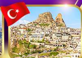
หุบเขาอุชิซาร์ คัปปาโดเกีย