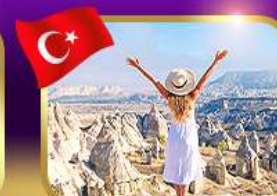
ชมความงาม หุบเขาแห่งรัก