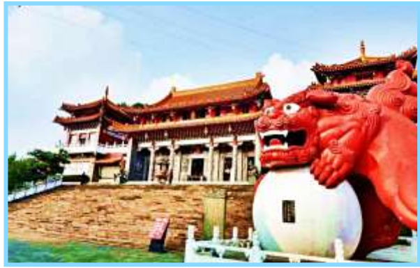
ปลาหนึ่งหนานโถว

นำท่านเดินทางไปกราบไหว้สิ่งศักดิ์สิทธิ์ ที่ วัดเหวินหวู่ ซึ่งหมายถึงศาสดาของจื่อเทพเจ้าแห่งปัญญา และเทพกวนอูเทพเจ้าแห่งความซื่อสัตย์รวมถึงสิงโตหินอ่อน 2 ตัวที่ตั้งอยู่หน้าวัดซึ่งมีมูลค่าถึงตัวละ 1 ล้านบาทเหรียญไต้หวัน