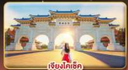
เจียงโคเช็ก