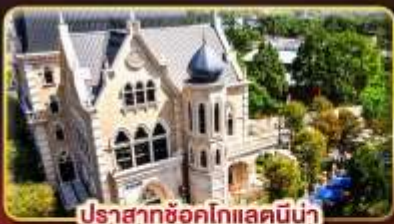
ปราสาทช็อคโกแลตมิน่า

มหานครแห่งเมืองสีกันแห่งไทเป ช้อปปิ้งใจ..ตลาดซีเหมินติง ตลาดโตง