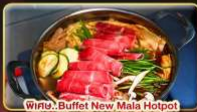
พิเศษ..Buffet New Mala Hotpot Free Flow Beer & Soft Drink