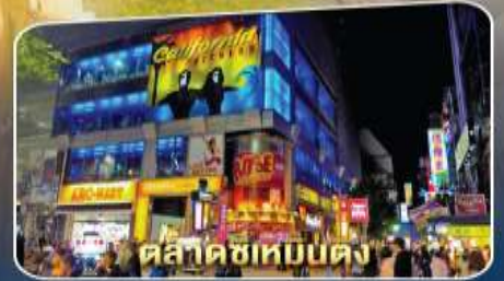
ตลาดซีเหมินตง