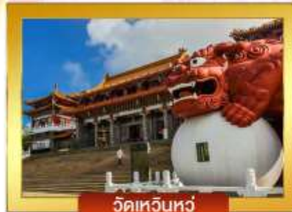
วัดเหวินหลู่