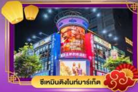
ซีเหมินดิงไนท์มาร์เก็ต