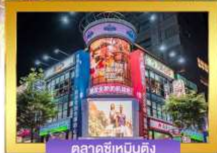
ตลาดซีเหมินติง