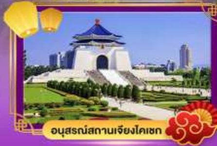
อนุสรณ์สถานเจียง ไคเชก