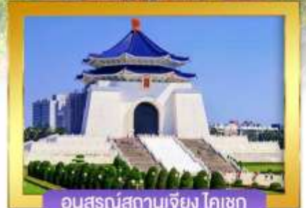
อนุสรณ์สถานเจียง ไคเชก