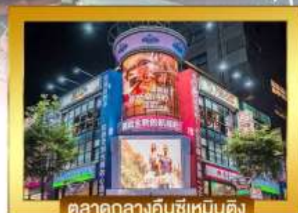
ตลาดกลางคืนซีเหมินติง