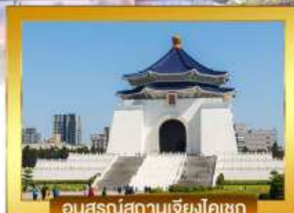
อนุสรณ์สถานเจียงไคเชก