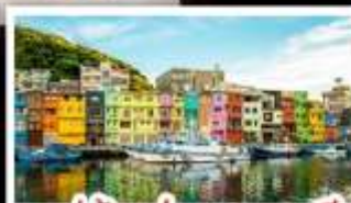
หมู่บ้านประมงหลากสี