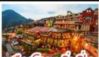
เมืองโบราณจิวเฟิ่น

ฟาร์มแกะซิงจิง - ทะเลสาบสวี่นจินตรา จิวเฟิ่น - หมู่บ้านประมงหลากสี - ไทเป 101 หมู่บ้านสายรุ้ง - ตลาดล่าหูก & ซีเหมินตง ปลาประ-ธานธิบดี - เขียวหลงเปา