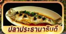
ปลาประรานาริมดี