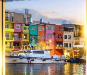
ท่าเรือประมงเจิ้งปิง