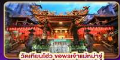
วัดเทียนเฮว จอพระเจ้าแม่มาจู่