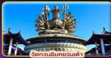
วัดกวนอิมทวณเต่า