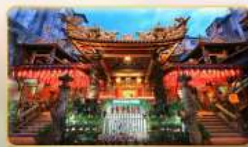
วัดเทียนฮั้ว จอพระเจ้าแม่หม่าจู้