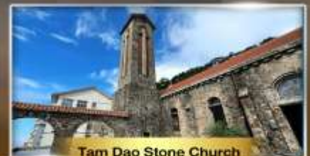
Tam Dao Stone Church