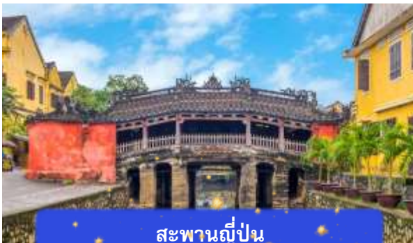
สะพานญี่ปุ่น

จากนั้นนำท่านเดินทางสู่ เมืองโบราณฮอยอัน เมืองมรดกโลกที่ยังคงเอกลักษณ์และรักษาวัฒนธรรมไว้อย่างดีเยี่ยม โดยท่านสามารถเดินเล่น ถ่ายรูป ตามตรอกซอกซอยต่างๆ ได้ ไฮไลท์ของการมาถ่ายรูปเช็คอินที่นี่คือการได้ขึ้นไปถ่ายรูปจากมุมสูงของคาเฟ่ที่อยู่ตามซอกซอย นำท่านชม สะพานญี่ปุ่น สะพานแห่งมิตรไมตรี ที่ได้ชื่อนี้เนื่องจากสะพานแห่งนี้สร้างขึ้นโดยชุมชนชาวญี่ปุ่น เป็นสะพานที่สร้างขึ้นข้ามคลองที่ในอดีต 400 ปีกว่าที่ผ่านมา