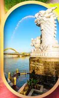
คาร์พดราท็อน