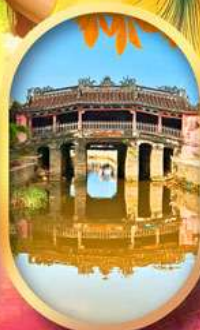
เมืองเก่าฮอยอัน