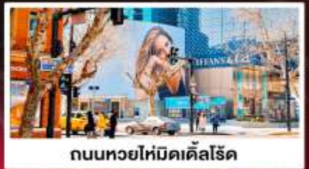
ถนนหยงไห่มีดเคิลโรด