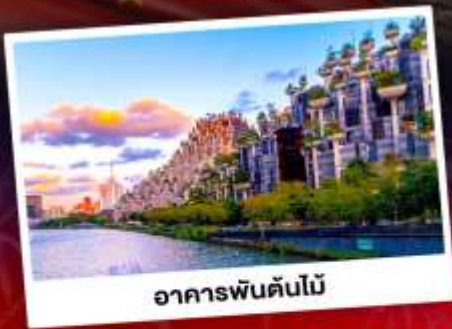
อาคารพันต้นไม้

ชมการแสดงพลุสุดปังที่สวนสนุกดิสนีย์แลนด์