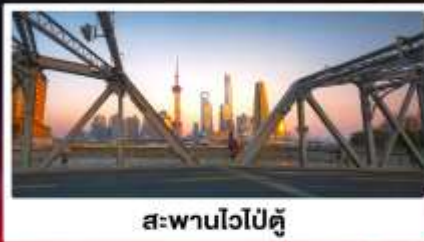
สะพานไวปู้ตู่