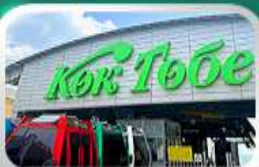
ซิมบูตอกเทชมวิวอัลมาตี

นั่งกระเช้าซิมบูลัค • ทะเลสาบโคลไซ • โบสถ์เซนต์คอป