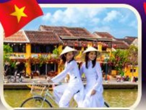
เช็คอินเมืองเก่าฮอยอัน