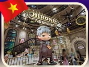
POPMART บานฮิเอป