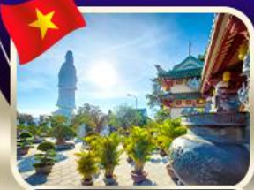
ขอพรกวณอิมวัดหลันอั้ง