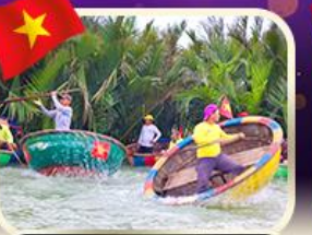
ล่องเรือกระด้งที่ทาน