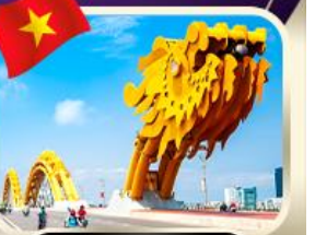
สะพานมังกร ดานัง