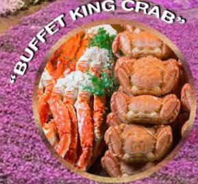
"BUFFET KING CRAB"