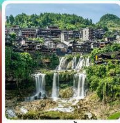
ฟูหรงเจิน