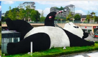
รูปปั้นหมีแพนด้าอนเซลฟี่