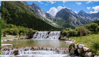
อุทยานแห่งชาติปี่เฟิงโกว