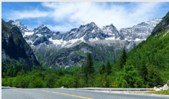
ภูเขาสี่ดรุณี (หุบเขาชวงเจียวโกว)