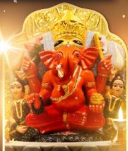
องค์สิทธินายิก