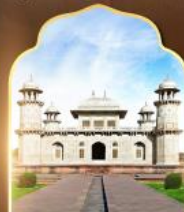
ทัชมาฮาลน้อย