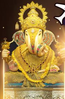
องค์ดีกษุท์พิเศษ