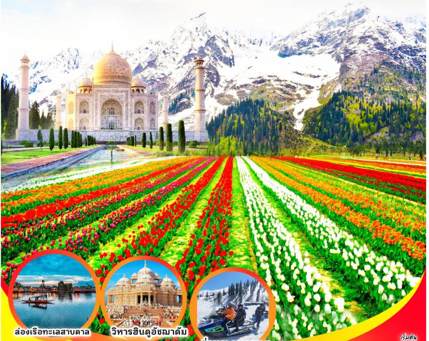
ล่องเรือทะเลสาบตาจ

เทศกาลทิวลิปบาน ในอ้อมกอดหิมาลัย อัครา ศรีนาคา กุลมาร์ค โซนามาร์ค เดลี 6วัน 5คืน