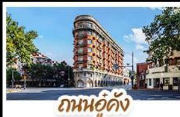
ถนนฮู่คัง