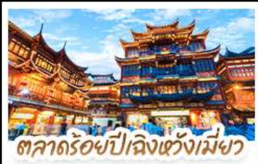
ตลาดร้อยปีลิ่งเซวี่เม่ฆา