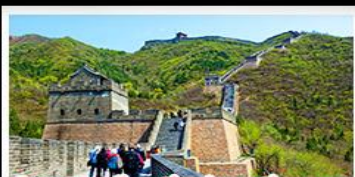
กำแพงเมืองจีนด่านจวิยงกวน