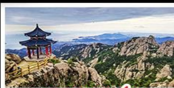
ภูเขาเหลาซาน