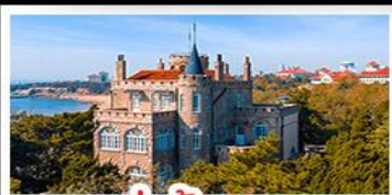
ป่าตึกวน

พระราชวังฤดูร้อน - วิวเมืองชิงเต่า รถไฟความเร็วสูง - ภูเขาเหลาซาน กำแพงเมืองจีนด่านจวิยงกวน - ป่าตึกวน พักโรงแรมระดับ 4 ดาว - ไม่หลงร้านช้อปปิ้ง มือพิเศษ เปิดปักกิ่ง , หม้อไฟซีฟู้ด