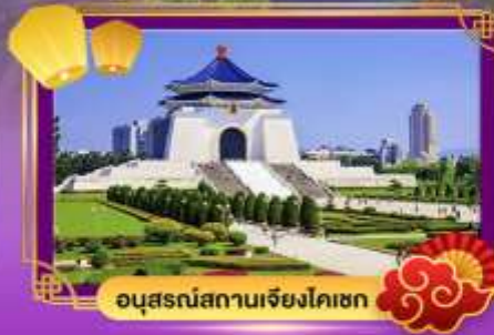
อนุสรณ์สถานเจียง ไคเชก