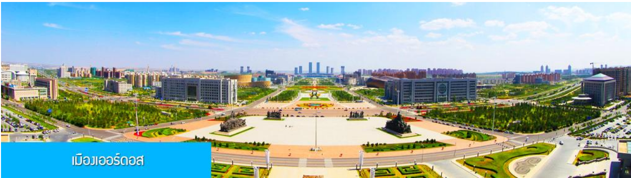
เมืองออร์ดอส